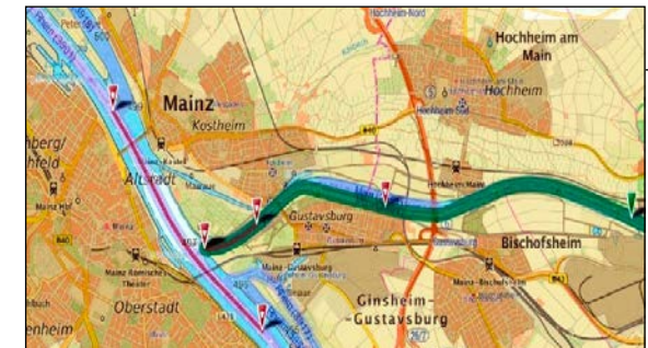
Kartenbasierte Darstellung von ELWIS-Informationen

Haben Sie Fragen/Feedback? info@elwis.de