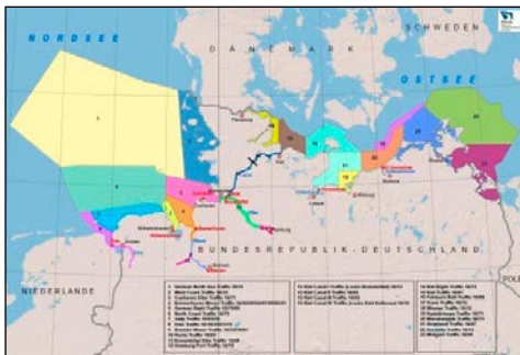
Verkehrskanäle der Verkehrszentralen im Küstenbereich

Besuchen Sie uns im Internet: www.elwis.de